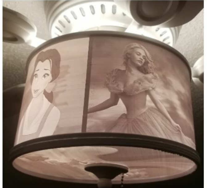
Curved Lithophane Maker