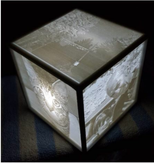
Lithophane Light Box Maker