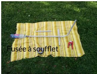
Fusée à soufflet