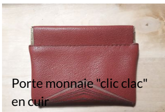
Porte monnaie "clic clac" en cuir