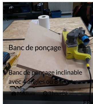
Banc de ponçage