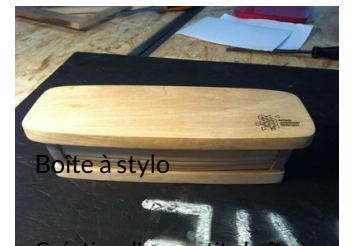
Boite à stylo