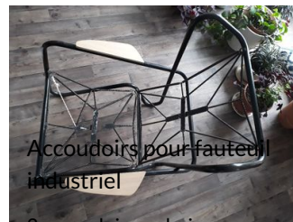
Accoudoirs pour fauteuil industriel

2 accoudoirs en bois pour fauteuil en métal.