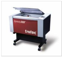
TROTEC SPEEDY 100 LASER