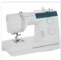
Machine à coudre