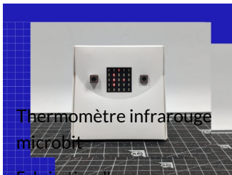
Thermomètre infrarouge microbit

Fabrication d'un thermomètre infrarouge ave..