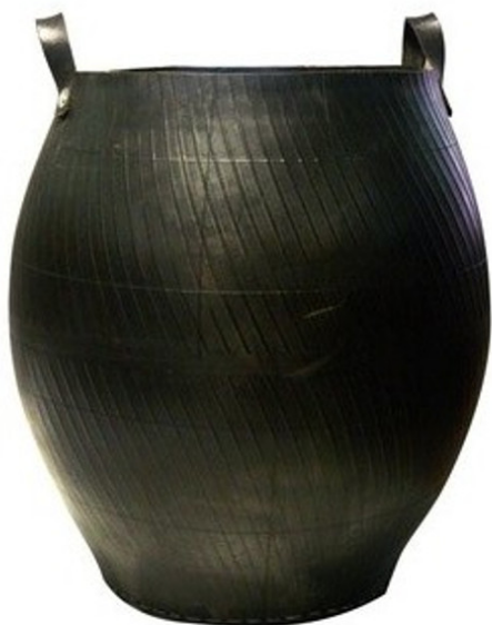
JARRE EN PNEU RECYCLÉ

L'objectif est de montrer à la population que ce qui est appelé déchets a encore une valeur et peut être réutilisé, recyclé valorisé.