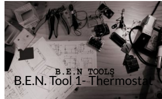
B.E.N. Tool 1 - Thermostat