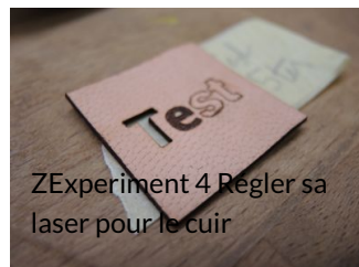
ZExperiment 4 Régler sa laser pour le cuir

Régler sa découpe laser pour le cuir, sans le brûler.