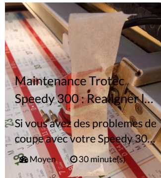
Maintenance Trotéc Speedy 300 : Realigner l...