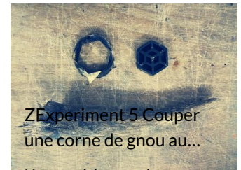
ZExperiment 5 Couper une corne de gnou au...