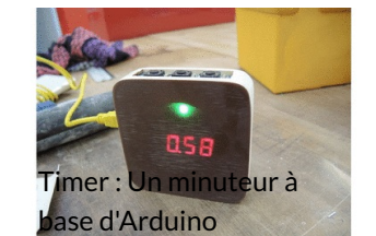
Timer : Un minuteur à base d'Arduino