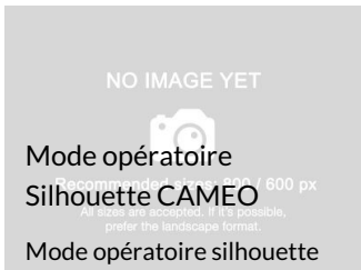
Mode opératoire Silhouette CAMEO