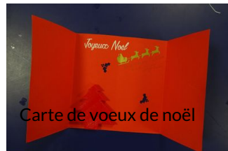
Carte de voeux de Noël