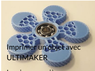
Imprimer un objet avec ULTIMAKER