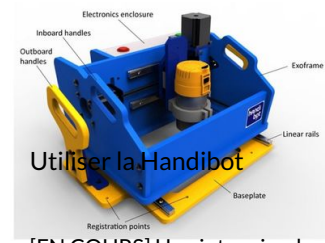
Utiliser la Handibot