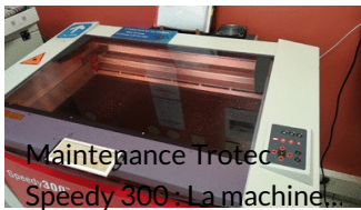
Maintenance Trotéc Speedy 300 : La machine...

L'histoire de comment on a réglé le problème