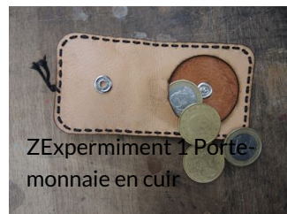
ZExperiment 1 Porte-monnaie en cuir

Petit porte-monnaie fabriqué à la découpe laser.