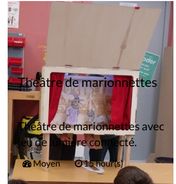
Théâtre de marionnettes

Théâtre de marionnettes avec jeu de lumière connecté.