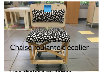
Chaise roulante d'écitier