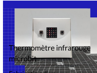
Thermomètre infrarouge microbit

Fabrication d'un thermomètre infrarouge ave..