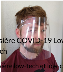
Visière COVID-19 Low Tech