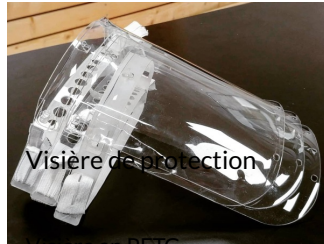
Visière de protection