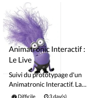
Animatronic Interactif : Le Live