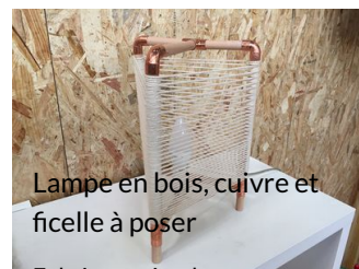
Lampe en bois, cuivre et ficelle à poser