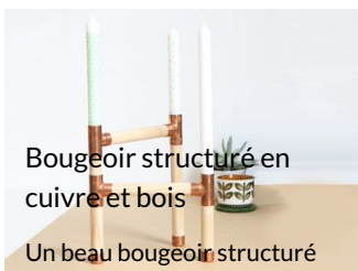
Bougeoir structuré en cuivre et bois

Un beau bougeoir structuré en cuivre et bois.