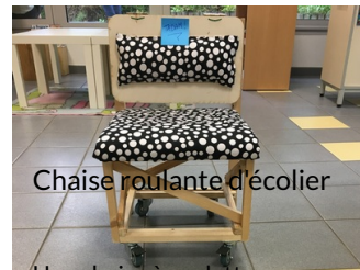
Chaise roulante d'écolier