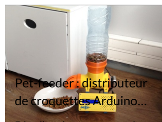
Pet-feeder : distributeur de croquettes Arduino...

Distribue les croquettes à heure fixe et à dose maîtrisée.