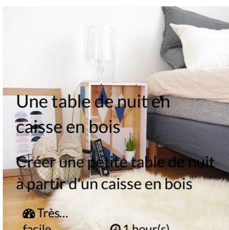
Une table de nuit en caisse en bois

Créer une petite table de nuit à partir d'un caisse en bois