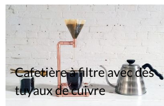
Cafetière à filtre avec des tuyaux de cuivre

Fabriquer une petite cafetière en cuivre sans soudure.