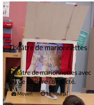
Théâtre de marionnettes

Théâtre de marionnettes avec jeu de lumière connecté.