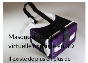
Masque de réalité virtuelle imprimé en 3D