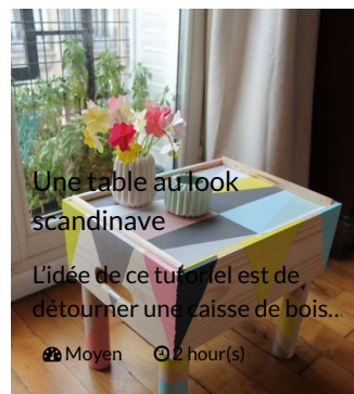
Une table au look scandinave