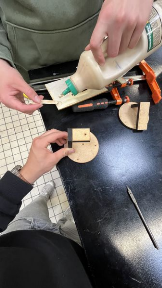
Taille de cet aperçu : 337 × 599 pixels. Fichier d'origine (2 268 × 4 032 pixels, taille du fichier : 2,49 Mio, type MIME : image/jpeg) Verre_IMG_0085