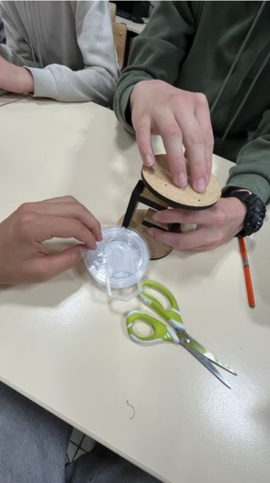
Taille de cet aperçu : 337 × 599 pixels. Fichier d'origine (2 268 × 4 032 pixels, taille du fichier : 1,92 Mio, type MIME : image/jpeg) Verre_IMG_0081