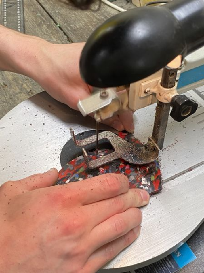
Taille de cet aperçu : 450 × 600 pixels. Fichier d'origine (3 024 × 4 032 pixels, taille du fichier : 1,9 Mio, type MIME : image/jpeg) VITRANNE_le_jeu_de_construction_IMG_3559