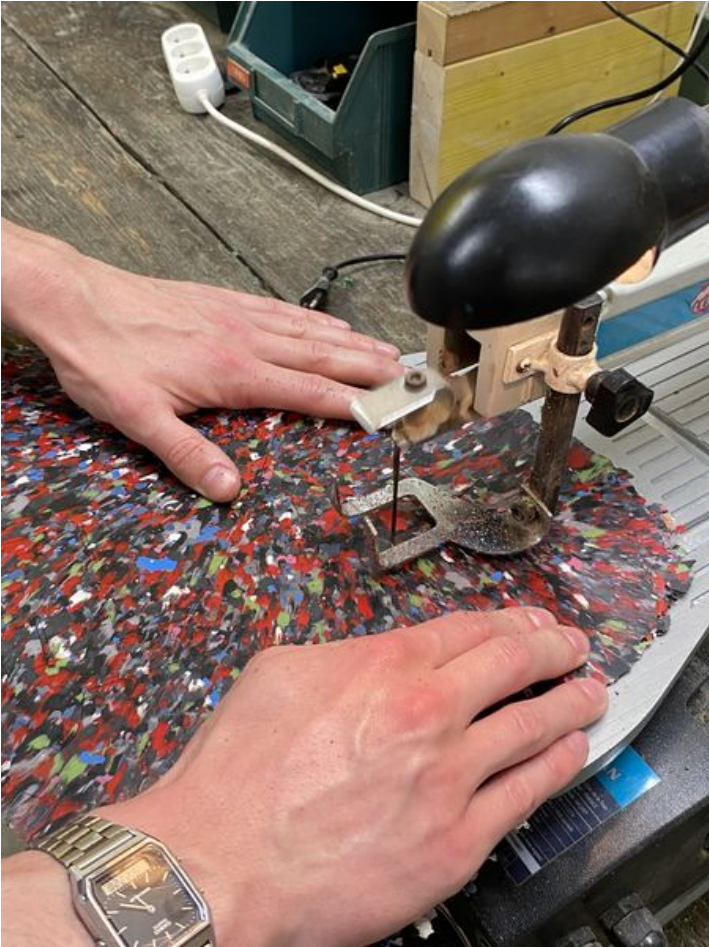
Taille de cet aperçu : 450 × 600 pixels. Fichier d'origine (3 024 × 4 032 pixels, taille du fichier : 2,68 Mio, type MIME : image/jpeg) VITRANNE_le_jeu_de_construction_IMG_3558