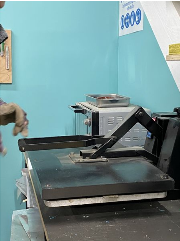
Taille de cet aperçu : 450 × 600 pixels. Fichier d'origine (3 024 × 4 032 pixels, taille du fichier : 1,6 Mio, type MIME : image/jpeg) VITRANNE_le_jeu_de_construction_IMG_3440