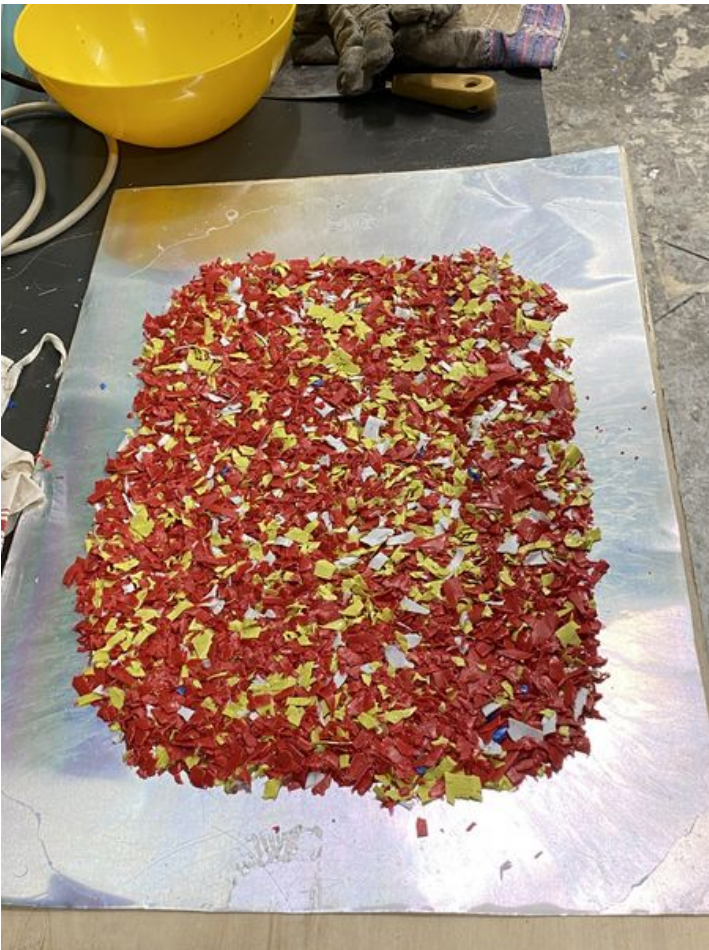
Taille de cet aperçu : 450 × 600 pixels. Fichier d'origine (3 024 × 4 032 pixels, taille du fichier : 3,36 Mio, type MIME : image/jpeg) VITRANNE_le_jeu_de_construction_IMG_3432