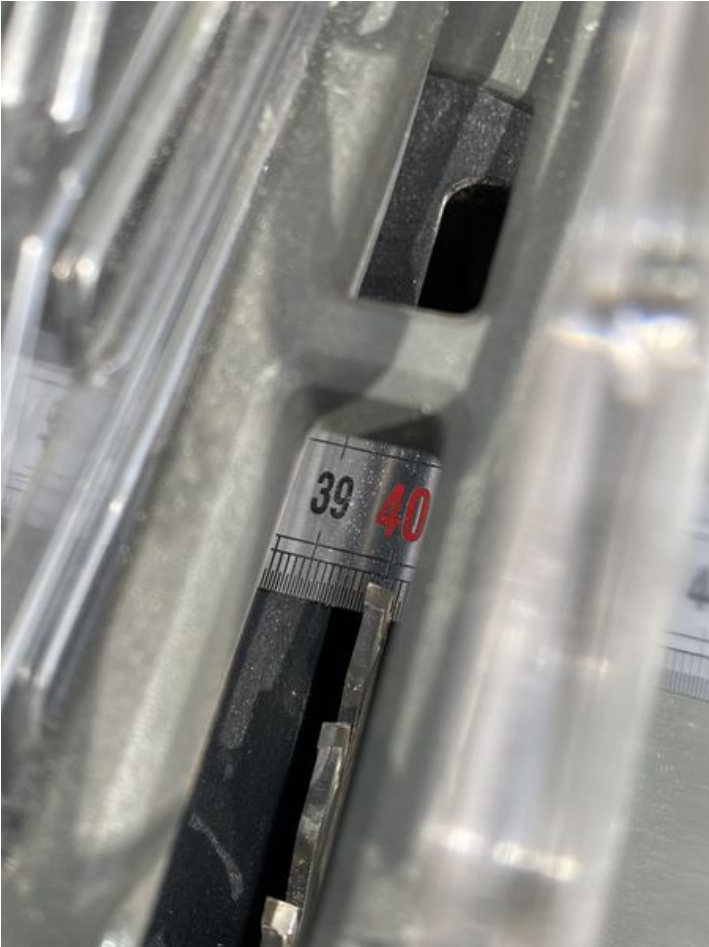
Taille de cet aperçu : 450 × 600 pixels. Fichier d'origine (3 024 × 4 032 pixels, taille du fichier : 1,78 Mio, type MIME : image/jpeg) Vérifier les mesures