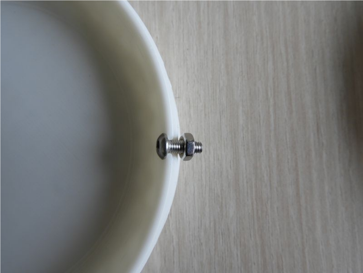
Taille de cet aperçu : 800 × 600 pixels. Fichier d'origine (5 184 × 3 888 pixels, taille du fichier : 4,1 Mio, type MIME : image/jpeg) Urne_de_Brousseau_revisit_e_DSCN0072