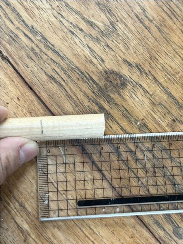
Taille de cet aperçu : 450 × 600 pixels. Fichier d'origine (3 024 × 4 032 pixels, taille du fichier : 2,8 Mio, type MIME : image/jpeg) Un_tuteur__la_menthe_IMG_9159