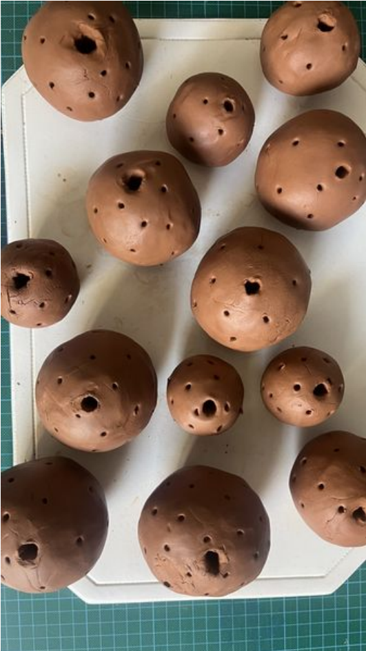
Taille de cet aperçu : 337 × 599 pixels. Fichier d'origine (2 268 × 4 032 pixels, taille du fichier : 2,45 Mio, type MIME : image/jpeg) Un_tuteur__la_menthe_FullSizeR