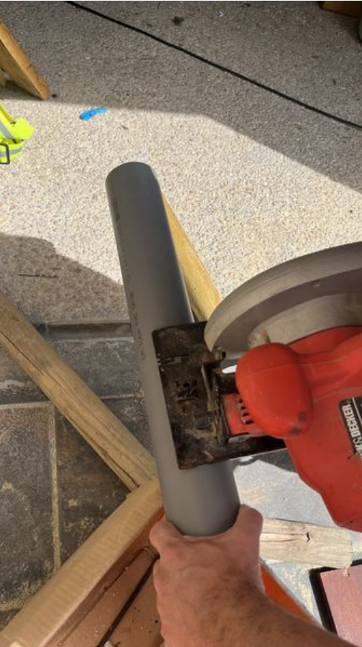
Taille de cet aperçu : 337 × 599 pixels. Fichier d'origine (2 268 × 4 032 pixels, taille du fichier : 2,5 Mio, type MIME : image/jpeg) Ue