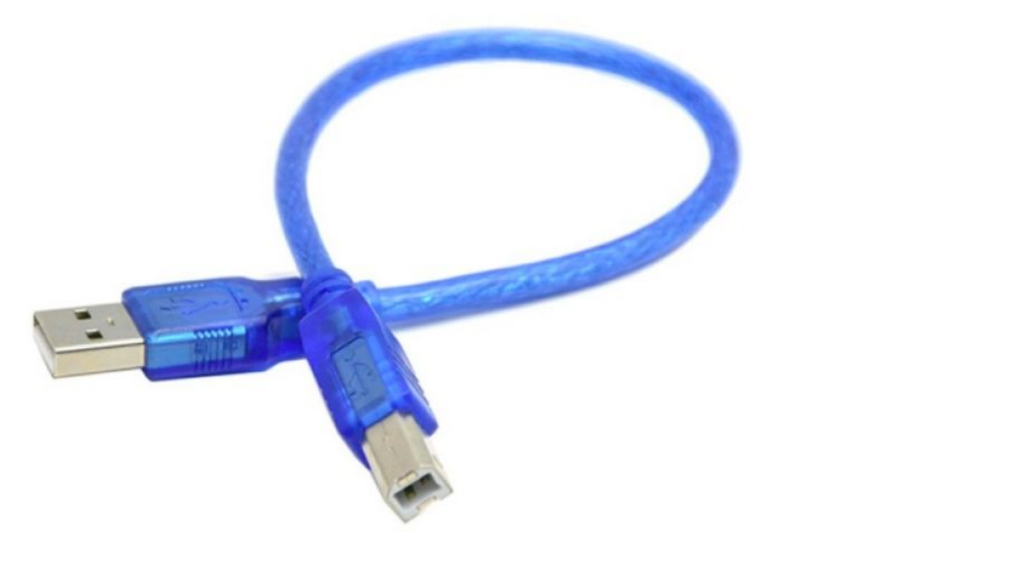
Taille de cet aperçu : 693 × 600 pixels. Fichier d'origine (700 × 606 pixels, taille du fichier : 70 Kio, type MIME : image/jpeg) Tuto_capteur_de_ponts_nm_cable-front