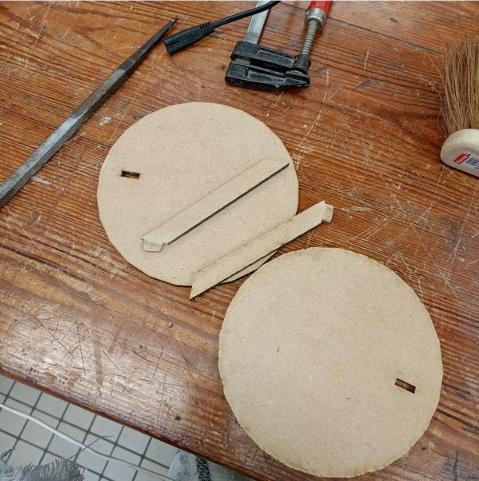
Taille de cet aperçu : 600 × 600 pixels. Fichier d'origine (3 468 × 3 468 pixels, taille du fichier : 6,67 Mio, type MIME : image/jpeg) tens_grit_IMG20250325164141