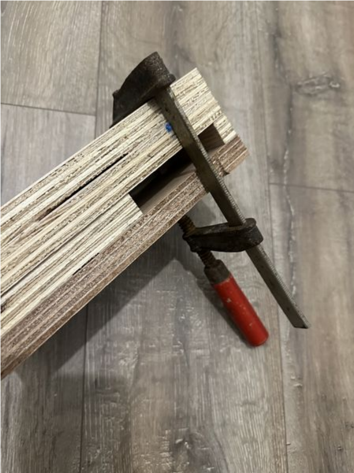
Taille de cet aperçu : 450 × 600 pixels. Fichier d'origine (3 024 × 4 032 pixels, taille du fichier : 2,61 Mio, type MIME : image/jpeg) Skodenn_IMG_5239