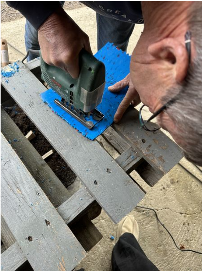
Taille de cet aperçu : 450 × 600 pixels. Fichier d'origine (3 024 × 4 032 pixels, taille du fichier : 3,42 Mio, type MIME : image/jpeg) Skodenn_IMG_5159