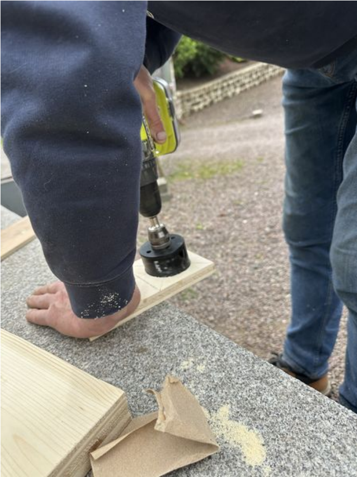
Taille de cet aperçu : 450 × 600 pixels. Fichier d'origine (3 024 × 4 032 pixels, taille du fichier : 3,27 Mio, type MIME : image/jpeg) Skodenn_IMG_5158