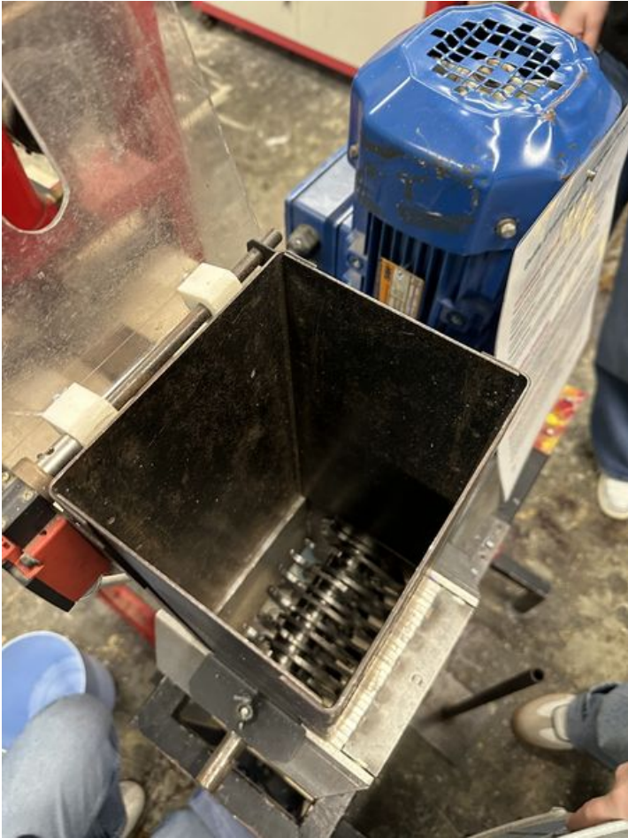
Taille de cet aperçu : 450 × 600 pixels. Fichier d'origine (3 024 × 4 032 pixels, taille du fichier : 2,98 Mio, type MIME : image/jpeg) Skodenn_IMG_4653