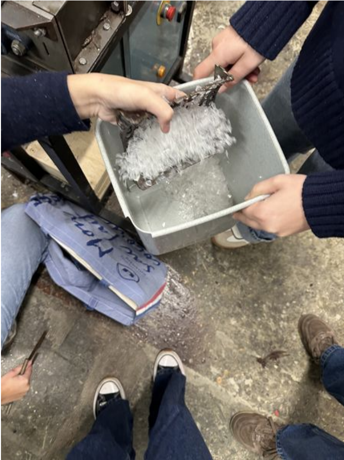
Taille de cet aperçu : 450 × 600 pixels. Fichier d'origine (3 024 × 4 032 pixels, taille du fichier : 2,77 Mio, type MIME : image/jpeg) Skodenn_IMG_4650