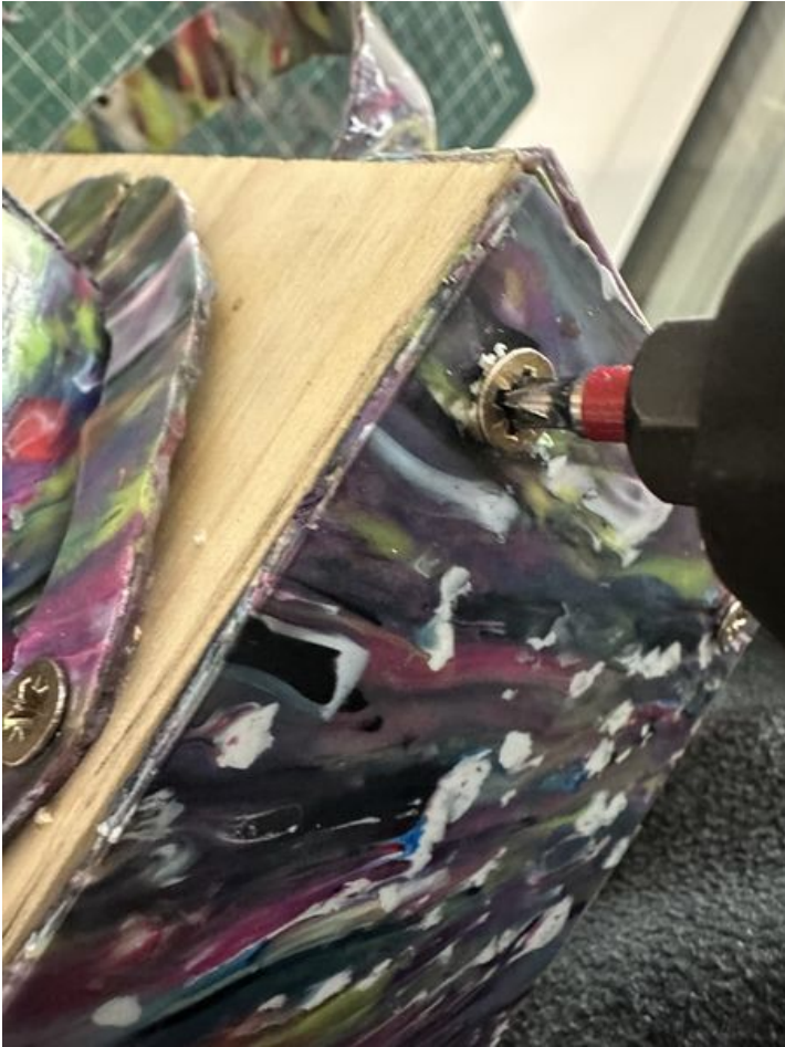
Taille de cet aperçu : 450 × 600 pixels. Fichier d'origine (3 024 × 4 032 pixels, taille du fichier : 1,93 Mio, type MIME : image/jpeg) SKODENN_2_IMG_5732