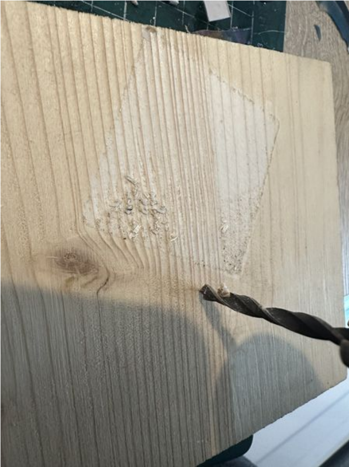
Taille de cet aperçu : 450 × 600 pixels. Fichier d'origine (3 024 × 4 032 pixels, taille du fichier : 2,6 Mio, type MIME : image/jpeg) SKODENN_2_IMG_5729