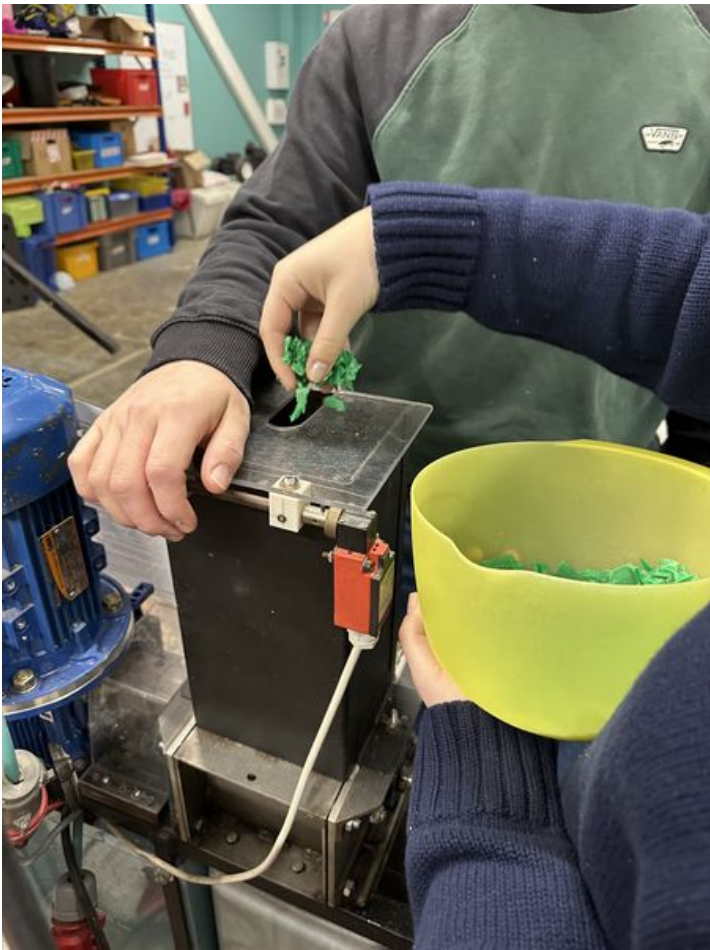
Taille de cet aperçu : 450 × 600 pixels. Fichier d'origine (3 024 × 4 032 pixels, taille du fichier : 2,73 Mio, type MIME : image/jpeg) SKODENN_2_IMG_4656