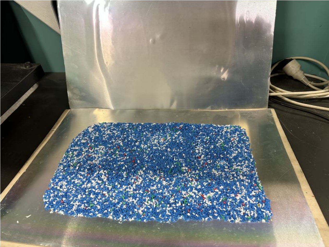
Taille de cet aperçu : 800 × 600 pixels. Fichier d'origine (4 032 × 3 024 pixels, taille du fichier : 4,15 Mio, type MIME : image/jpeg) SKODENN_2_IMG_4655