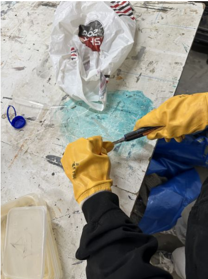
Taille de cet aperçu : 450 × 600 pixels. Fichier d'origine (3 024 × 4 032 pixels, taille du fichier : 2,66 Mio, type MIME : image/jpeg) SKODENN_2_IMG_4645