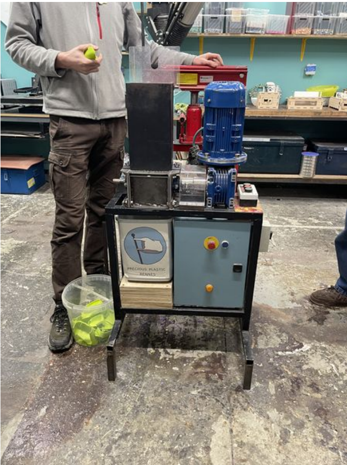
Taille de cet aperçu : 450 × 600 pixels. Fichier d'origine (3 024 × 4 032 pixels, taille du fichier : 3,67 Mio, type MIME : image/jpeg) Recyclage_de_plastique_PLA_IMG_0402_2