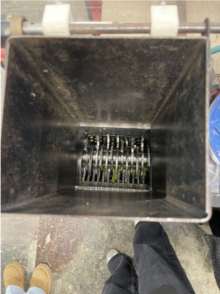
Taille de cet aperçu : 450 × 600 pixels. Fichier d'origine (3 024 × 4 032 pixels, taille du fichier : 2,09 Mio, type MIME : image/jpeg) Recyclage_de_plastique_PLA_IMG_0401