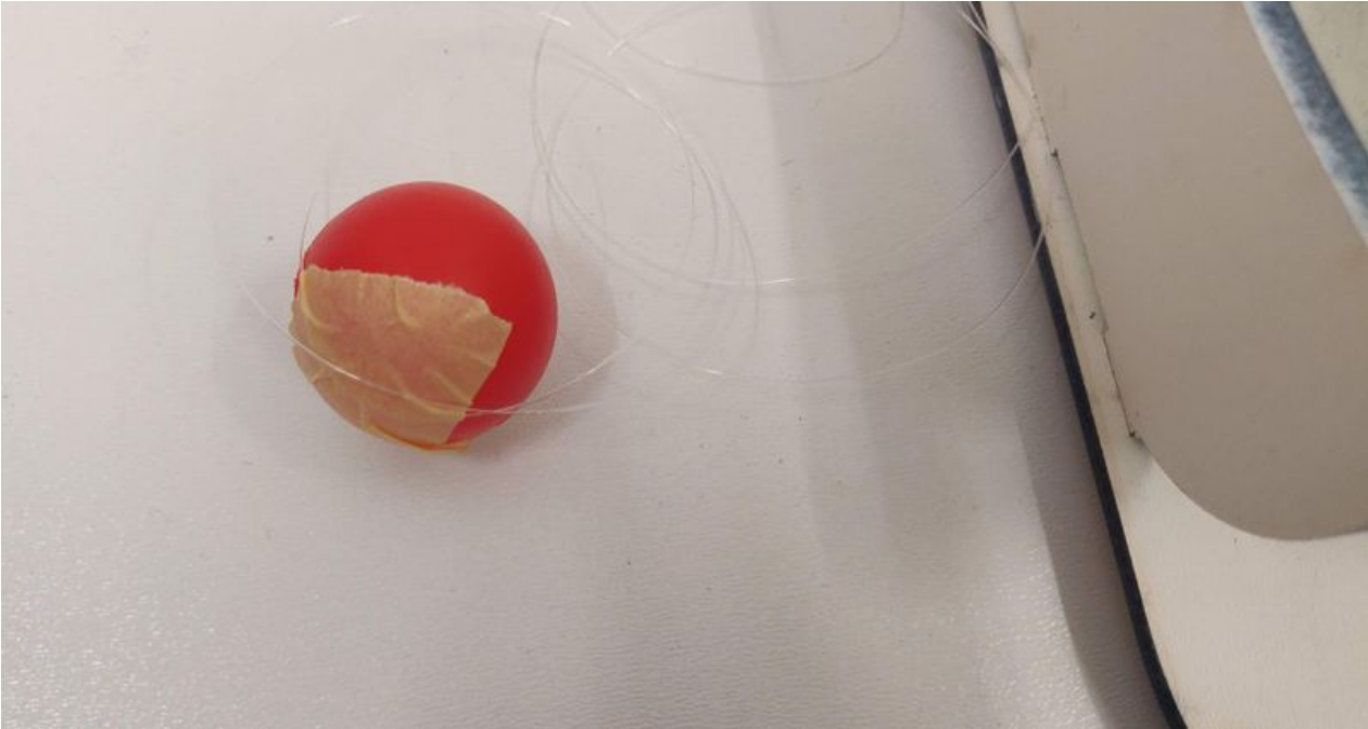
Taille de cet aperçu : 800 × 426 pixels. Fichier d'origine (3 823 × 2 038 pixels, taille du fichier : 504 Kio, type MIME : image/jpeg) Quidditch_de_Table_Ass._balle_1