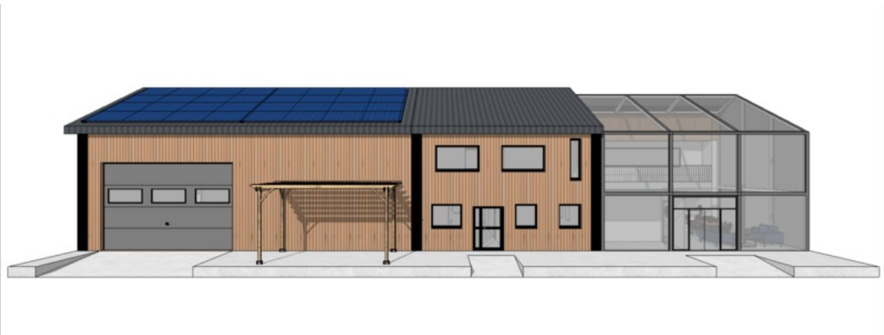
Taille de cet aperçu :800 × 299 pixels. Fichier d'origine (1 919 × 717 pixels, taille du fichier : 342 Kio, type MIME : image/png) Projet_FabLab_2_Face_Sud2