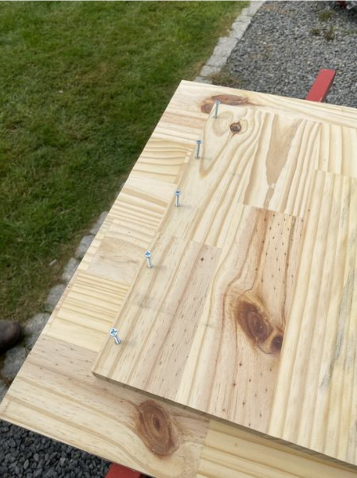
Taille de cet aperçu : 450 × 600 pixels. Fichier d'origine (3 024 × 4 032 pixels, taille du fichier : 2,75 Mio, type MIME : image/jpeg) Pré-visser les 5 vis