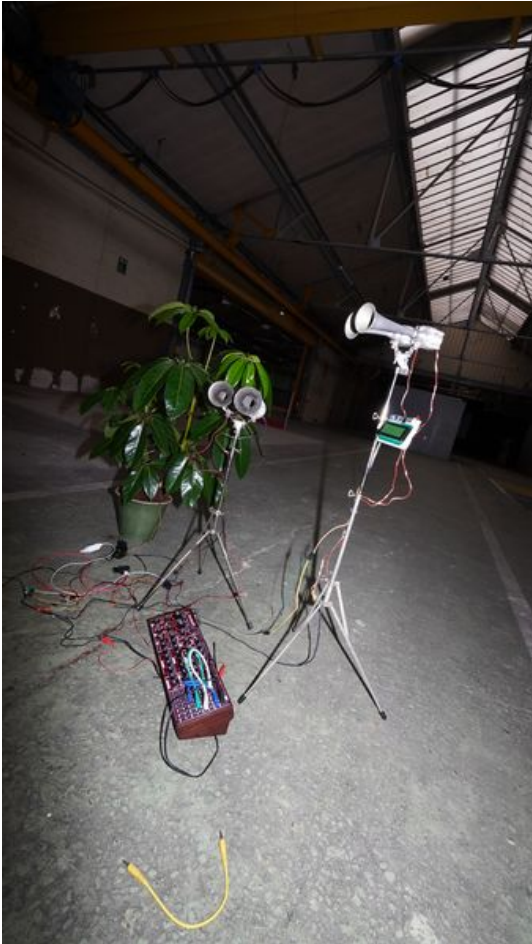
Taille de cet aperçu : 337 × 599 pixels. Fichier d'origine (3 376 × 6 000 pixels, taille du fichier : 14,06 Mio, type MIME : image/jpeg) Piano_automate_DSC03127