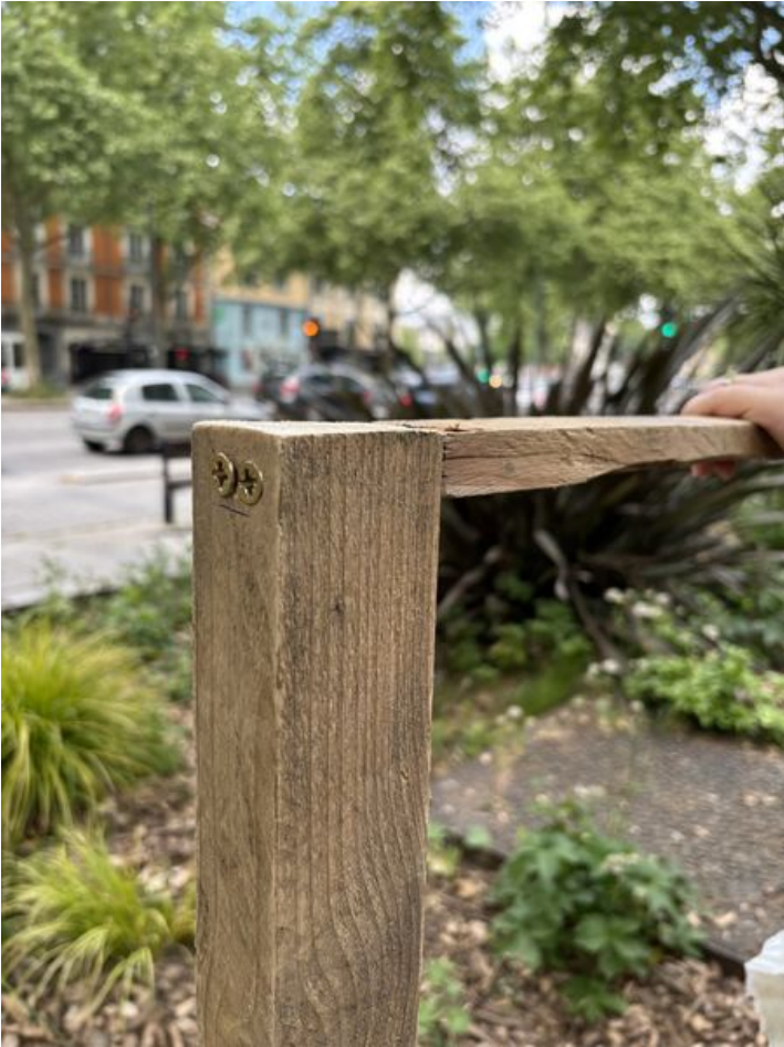
Taille de cet aperçu : 450 × 600 pixels. Fichier d'origine (4 284 × 5 712 pixels, taille du fichier : 3,22 Mio, type MIME : image/jpeg) Oreille_urbaine_IMG_6567_2