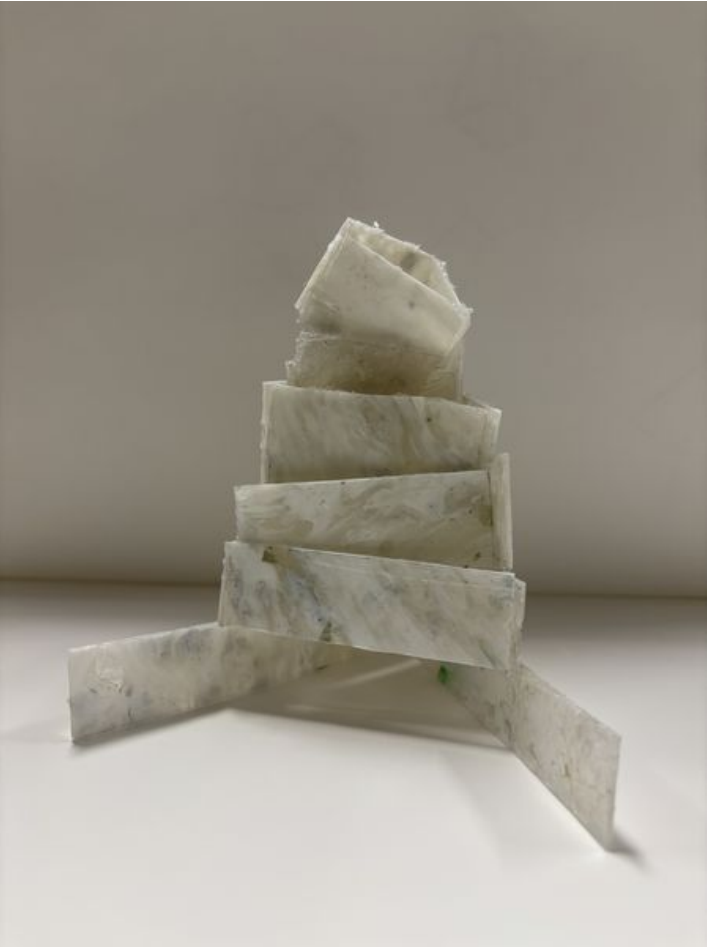
Taille de cet aperçu : 450 × 600 pixels. Fichier d'origine (4 284 × 5 712 pixels, taille du fichier : 2,43 Mio, type MIME : image/jpeg) oreille_urbaine_IMG_6501