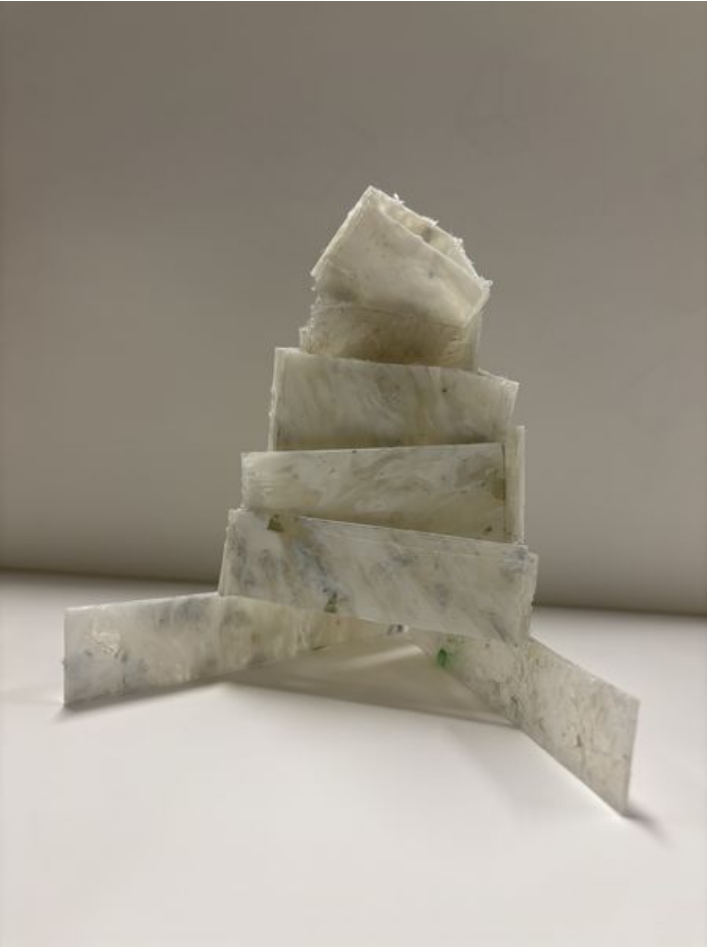
Taille de cet aperçu : 450 × 600 pixels. Fichier d'origine (4 284 × 5 712 pixels, taille du fichier : 2,34 Mio, type MIME : image/jpeg) oreille_urbaine_IMG_6500