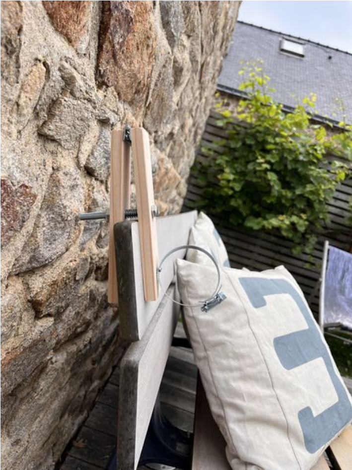
Taille de cet aperçu : 450 × 600 pixels. Fichier d'origine (3 024 × 4 032 pixels, taille du fichier : 3,6 Mio, type MIME : image/jpeg) Murmur_num_ro_2_IMG_9381