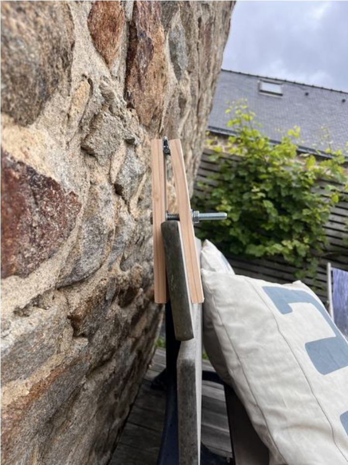
Taille de cet aperçu : 450 × 600 pixels. Fichier d'origine (3 024 × 4 032 pixels, taille du fichier : 3,63 Mio, type MIME : image/jpeg) Murmur_num_ro_2_IMG_9380