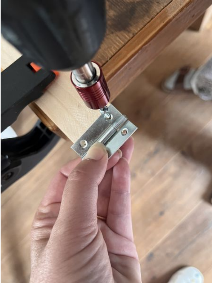
Taille de cet aperçu : 450 × 600 pixels. Fichier d'origine (3 024 × 4 032 pixels, taille du fichier : 2,46 Mio, type MIME : image/jpeg) Murmur_num_ro_2_IMG_9378