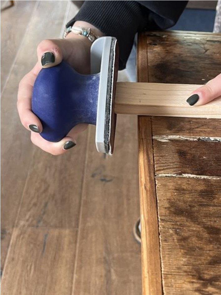
Taille de cet aperçu : 450 × 600 pixels. Fichier d'origine (3 024 × 4 032 pixels, taille du fichier : 1,81 Mio, type MIME : image/jpeg) Murmur_num_ro_2_IMG_9372