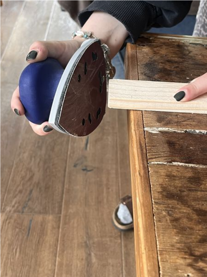
Taille de cet aperçu : 450 × 600 pixels. Fichier d'origine (3 024 × 4 032 pixels, taille du fichier : 1,98 Mio, type MIME : image/jpeg) Murmur_num_ro_2_IMG_9371