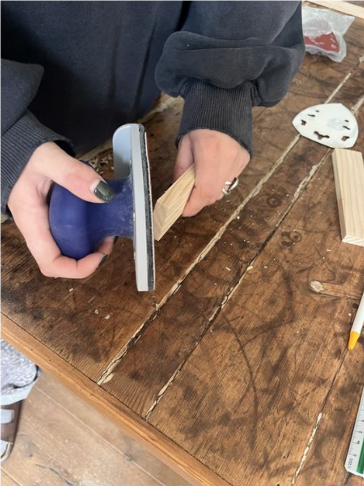
Taille de cet aperçu : 450 × 600 pixels. Fichier d'origine (3 024 × 4 032 pixels, taille du fichier : 2,87 Mio, type MIME : image/jpeg) Murmur_num_ro_2_IMG_9370