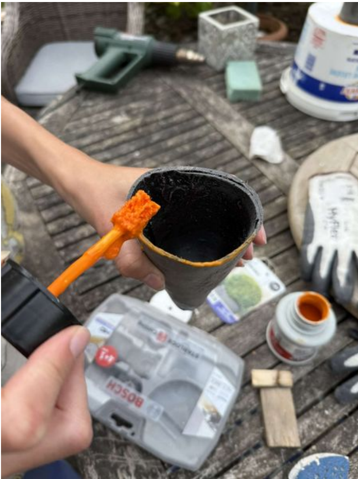
Taille de cet aperçu : 450 × 600 pixels. Fichier d'origine (1 656 × 2 208 pixels, taille du fichier : 357 Kio, type MIME : image/jpeg) Murmur_num_ro_1_IMG_9396