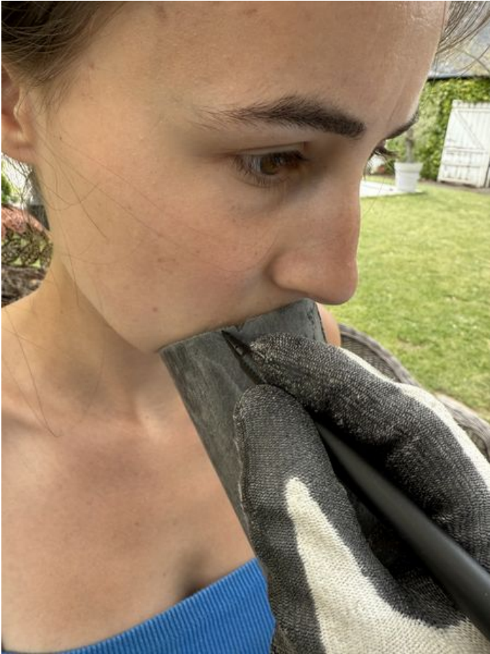
Taille de cet aperçu : 450 × 600 pixels. Fichier d'origine (3 024 × 4 032 pixels, taille du fichier : 2,13 Mio, type MIME : image/jpeg) Murmur_num_ro_1_IMG_1917